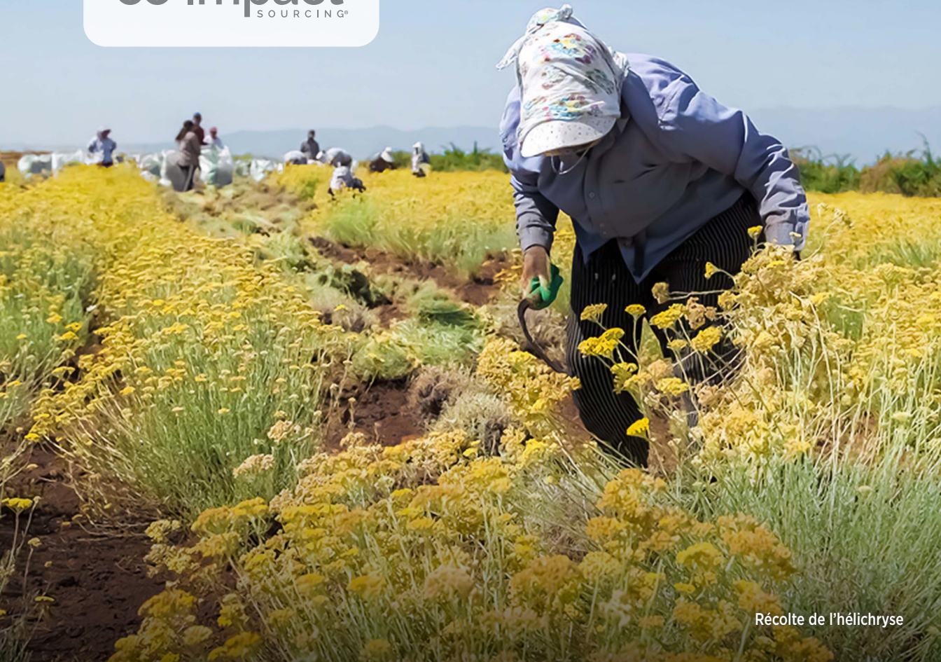
Récolte de l'hélichryse